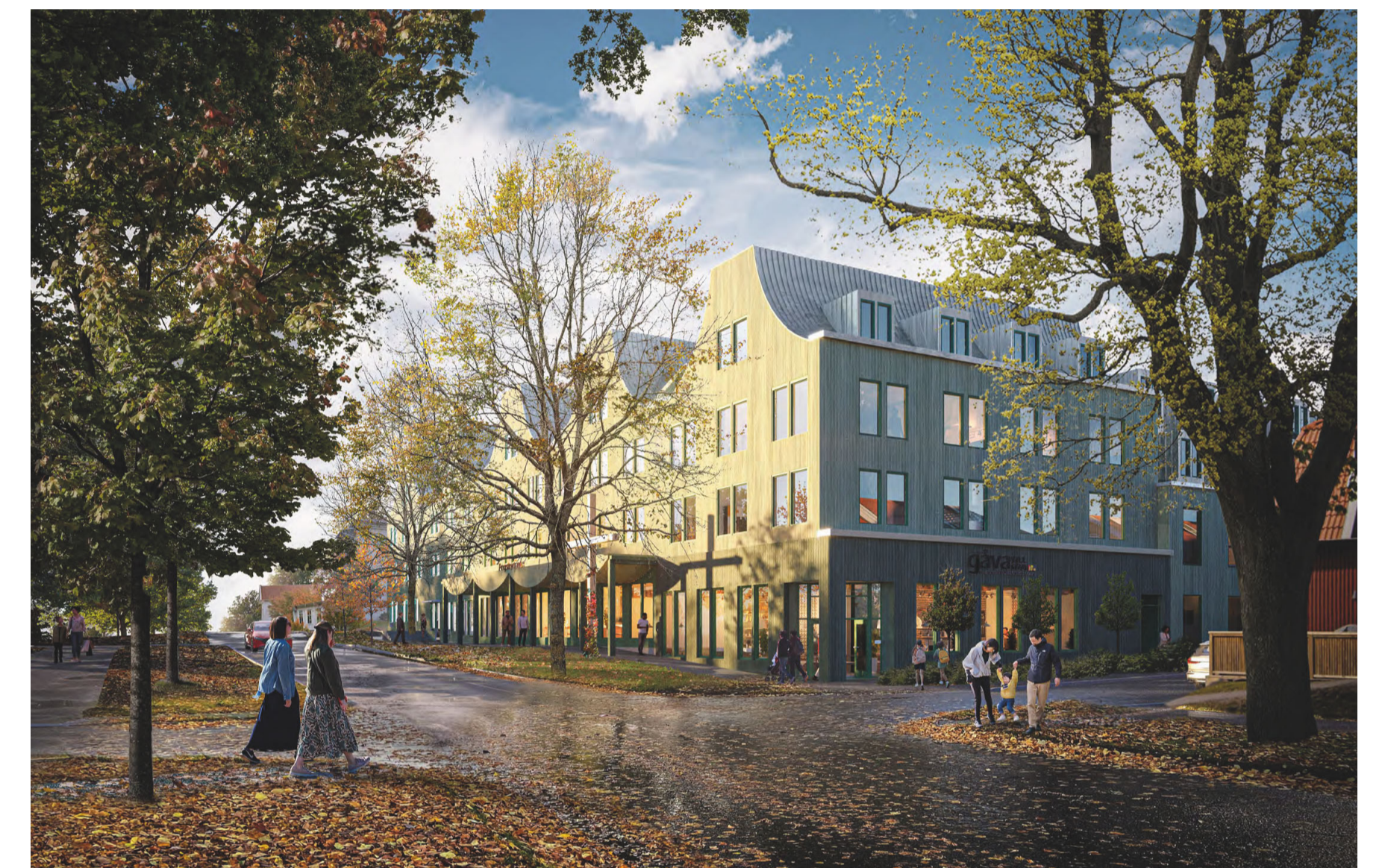
Bilden visar en vy sett från nordost, med Landskyrkoallén i förgrunden, och illustrerar hur den nya kyrkobyggnaden inom Afzeliiskolan 3 kan utformas (Okidoki arkitekter).