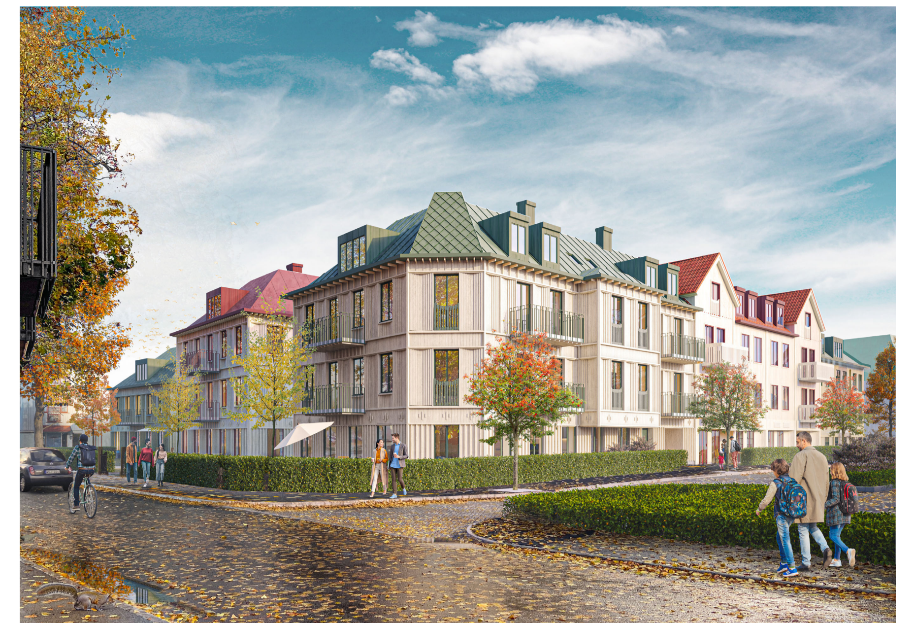
Bilden visar en vy sett från sydväst, med Prästgårdsvägen i förgrunden, och illustrerar hur ny bebyggelse inom Afzeliiskolan 2 kan utformas (Okidoki arkitekter).