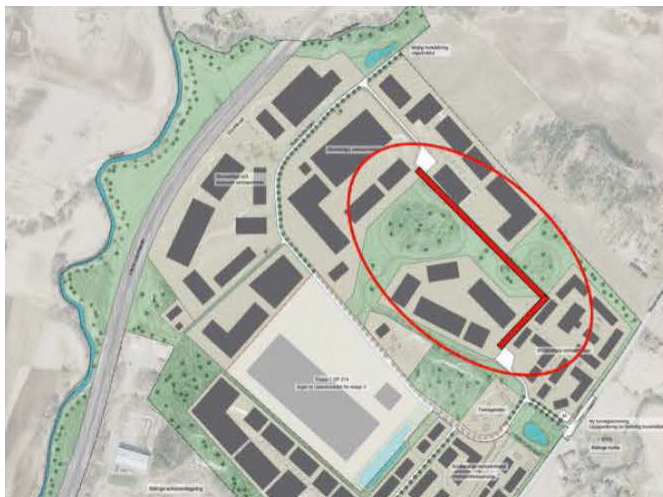
Figur 2: Visar förslag på vägnät som möjliggör rundkörning.

Räddningstjänsten lyfter även att det planerade vägnätet inte möjliggör för rundkörning, vilket skulle vara mycket fördelaktigt om det gjorde det i händelse av olycka. Förslagsvis utökas vägnätet enligt nedan som möjliggör rundkörning, se figur 2.