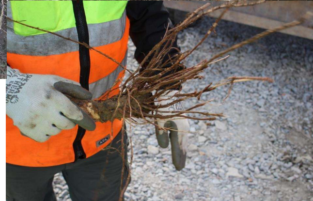
Massiv rotutveckling 2 år efter beskärning