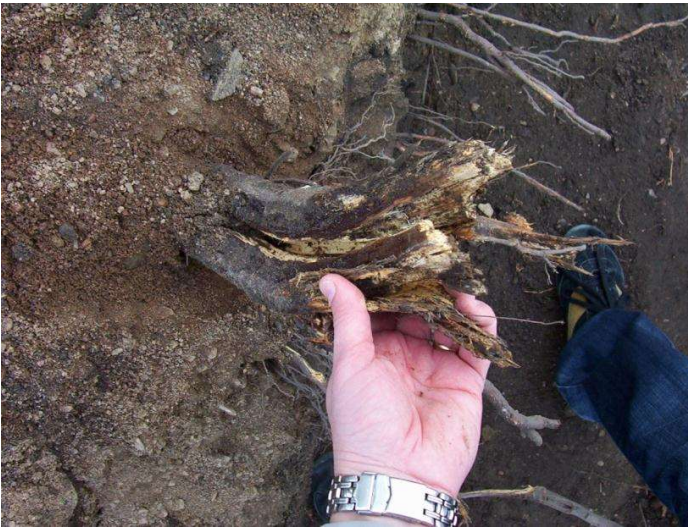
Stor fläk skadad rot beskärs med ett rent snitt.