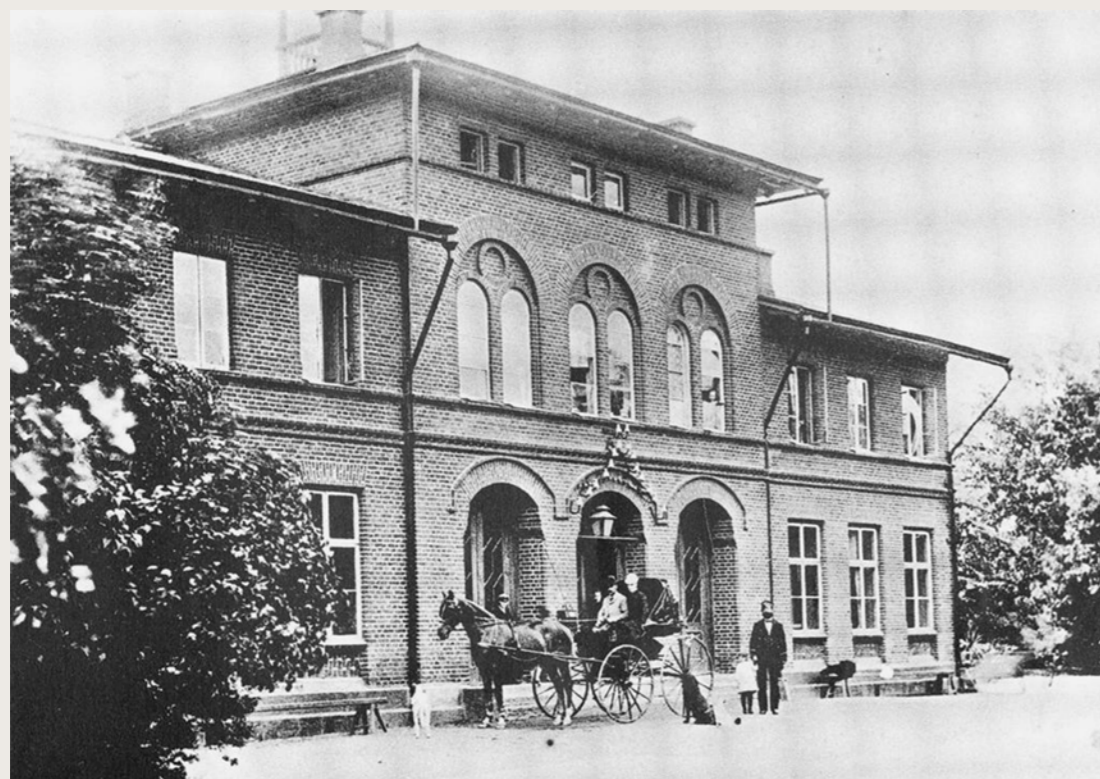
Fotografi kring 1890. På stationsplanen ser vi ett ekipage med familjen Stoddard från Brynjenäs slott.