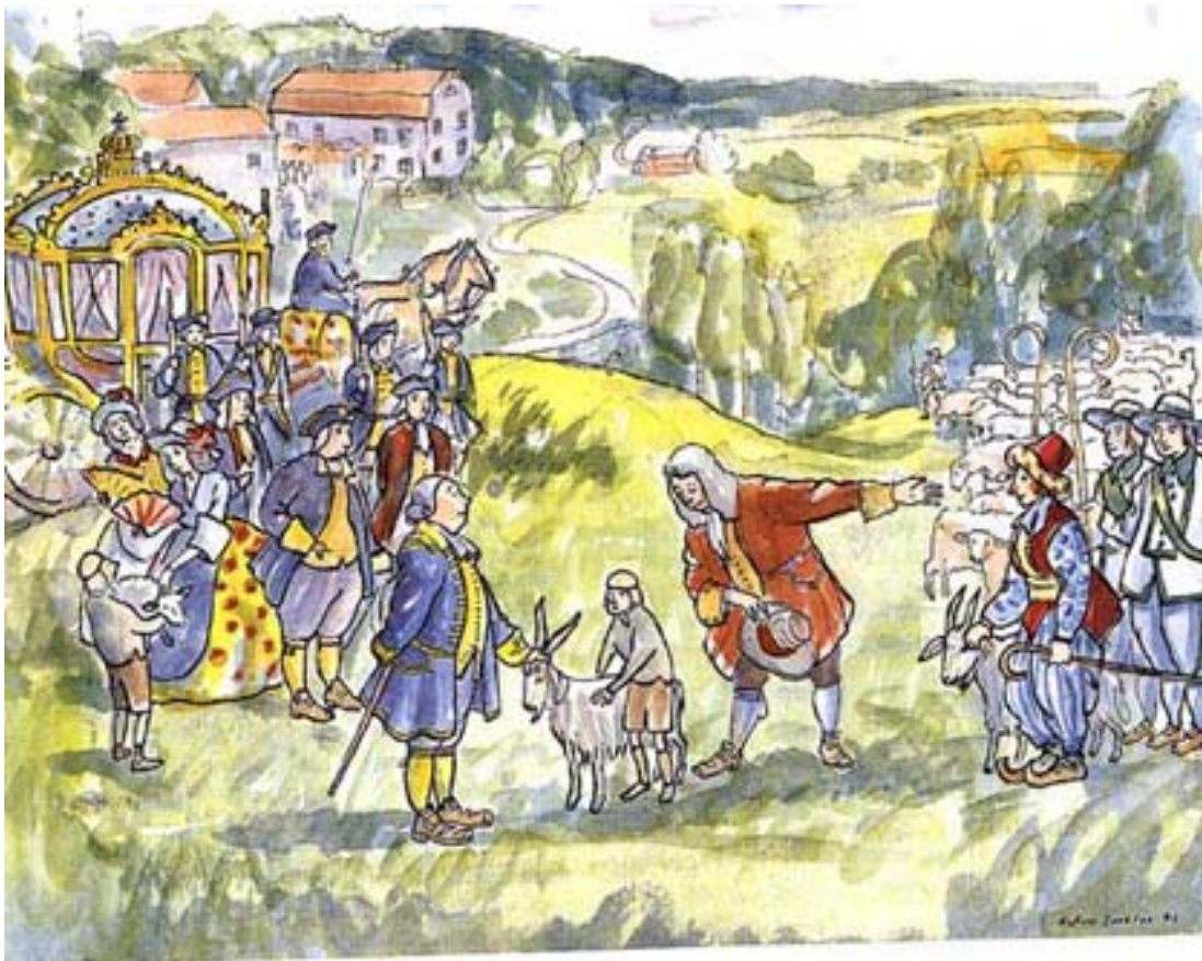
Akvarell av Anders Suneson.

Staden har utvecklats kontinuerligt ända sedan 1600-talet. Rom byggdes inte på en dag... inte heller Alingsås!