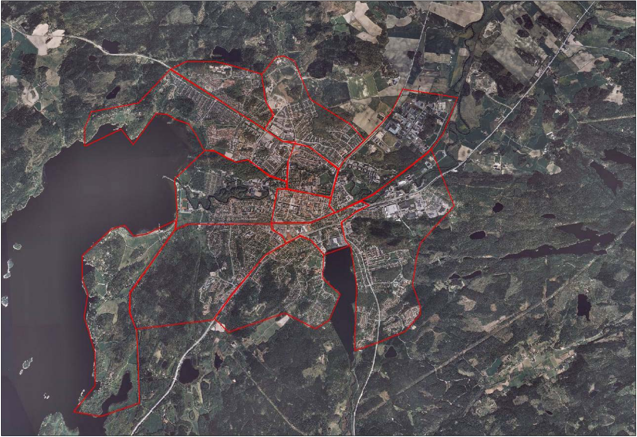
Karta över Alingsås med stadsdelarna markerade med rött.